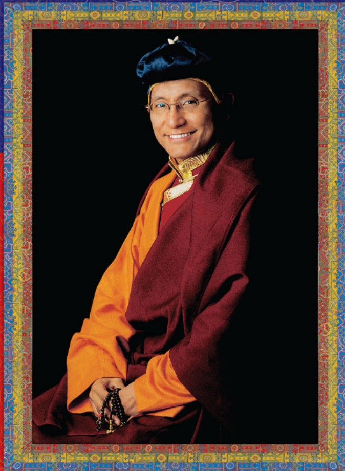
PHÁP VƯƠNG GYALWANG DRUKPA ĐỜI THỨ XII